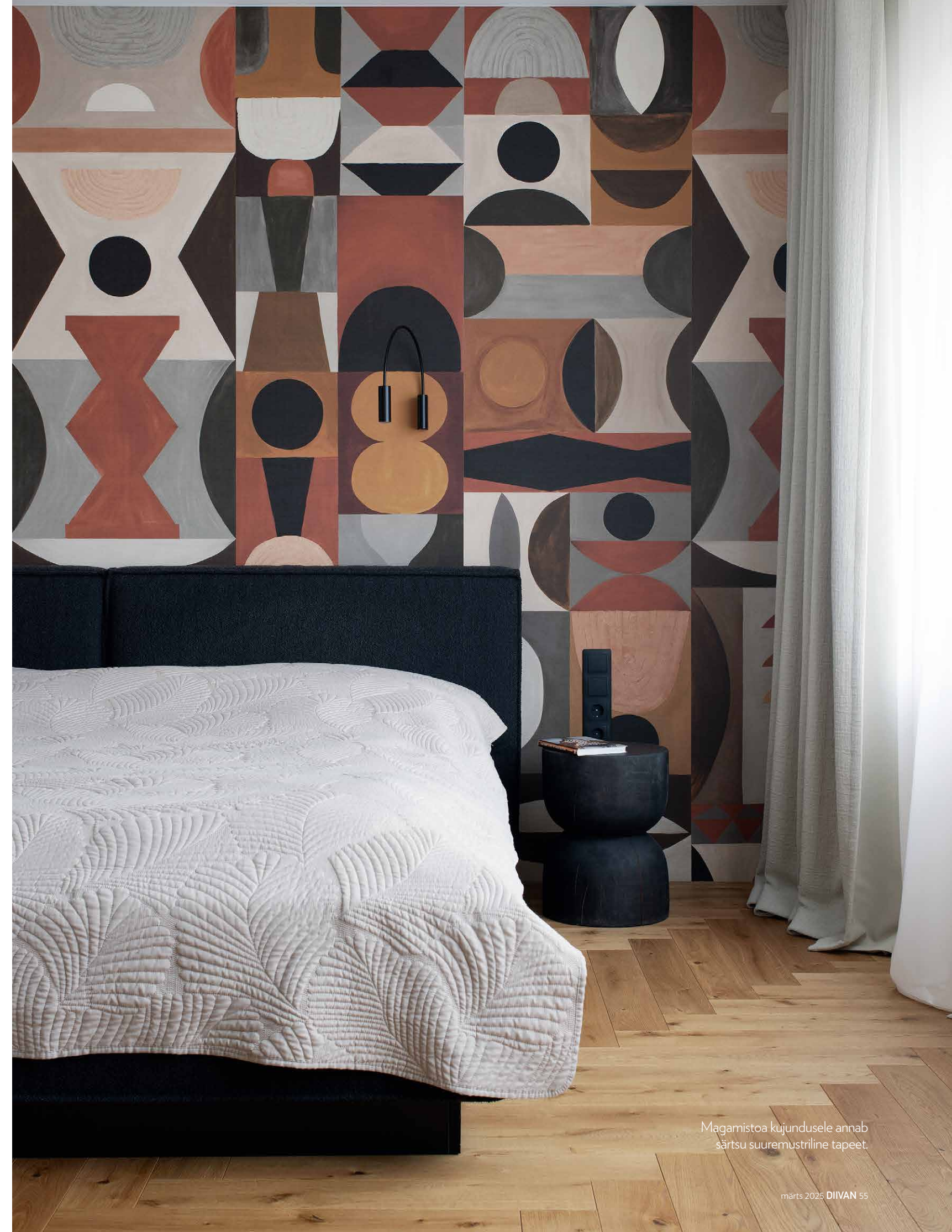
Magamistoa kujundusele annab särtsu suuremustriline tapeet.