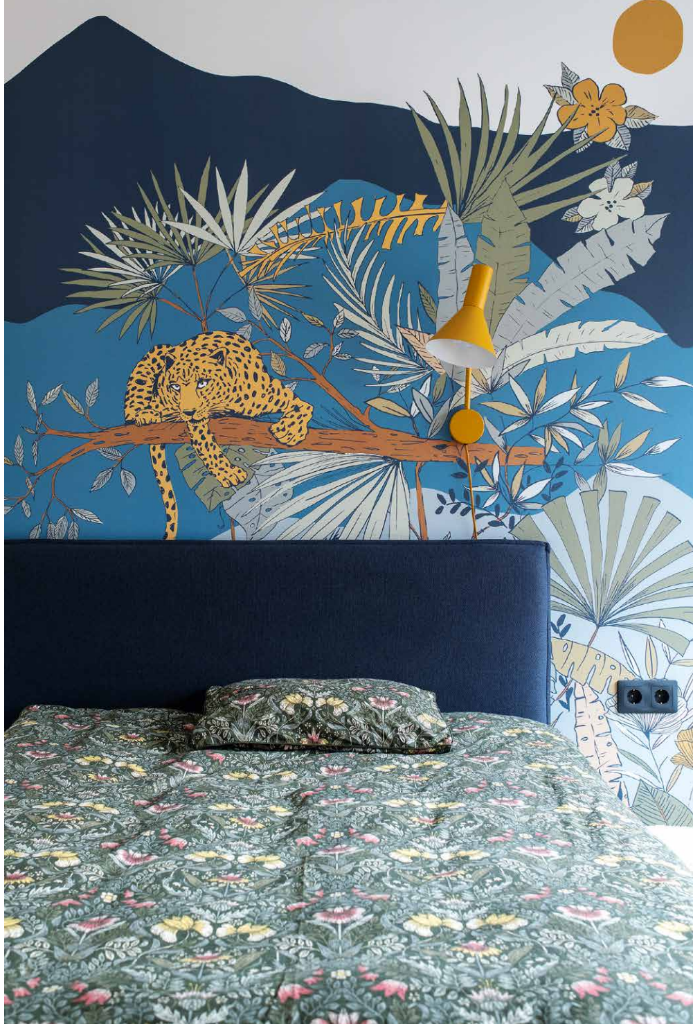
Lastetubadesse toodi lustakas džunglitemaatika.